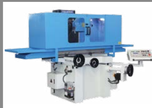
· 4080A 大半罩