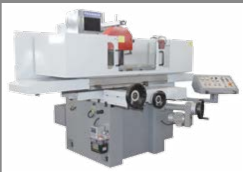
· 4080R 小半罩